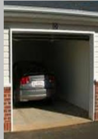
Motorji z notranjim zgorevanjem

V prostoru pride v največ primerih do nastanka prevelikih koncentracij CO zaradi: