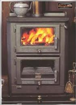
Peči na trdna goriva, naftne derivate (kurilno olje, bencin, petrolej)