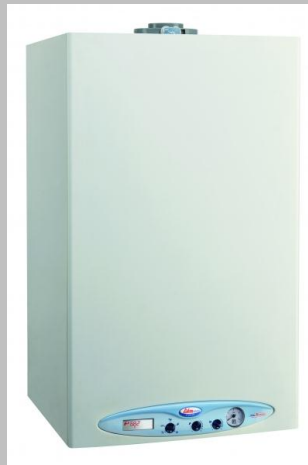
Plinske peči in bojlerji